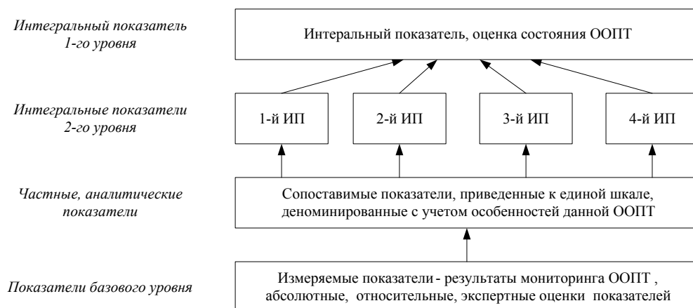
Рис. 2. Иерархическая система интегральных показателей

После построения аналитической системы показателей можно приступать к вычислению интегральных показателей состояния заповедника первого и второго уровня. Интегральный показатель первого уровня есть оценка состояния ООПТ, в нашем случае x^{\wedge}=Gx^{*}(y) , x \in R1 , где Gx^{*} – псевдообратный оператор для y=G(x) (см. Рис. 1). Интегральные показатели второго уровня есть представления интегрального показателя первого уровня в векторном виде. Такое представление более информативно, особенно, если оно отображает отдельные виды деятельности ООПТ. Например, на Рис. 2. Первый ИП – природоохранная ценность заповедника, второй ИП – оценка работы службы охраны заповедника, третий ИП – оценка научной работы заповедника, и четвертый ИП – оценка просветительской работы заповедника. Вектор оценки состояния ООПТ x^{\wedge} вычисляется подобным образом: x^{\wedge}=Gx^{*}(y) , x \in R4 , где Gx^{*} – псевдообратный оператор для y=G(x) . Для принятия управленческого решения, экспертам могут быть предложены показатели как первого, так и второго уровня. Аналогично вычисляется интегральный показатель оценки воздействий на ООПТ z^{\wedge} .